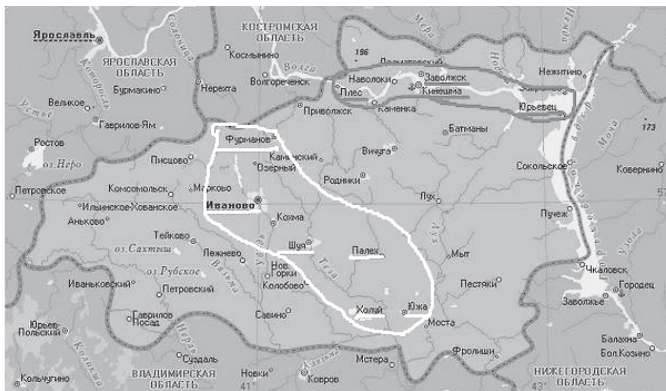
Рис. 2. Территории формирования туристических кластеров в Ивановской области

ное послужило предпосылкой к созданию на базе Кинешмы, Плёса, Юрьевца и Заволжска Волжского туристического кластера (рис. 1).